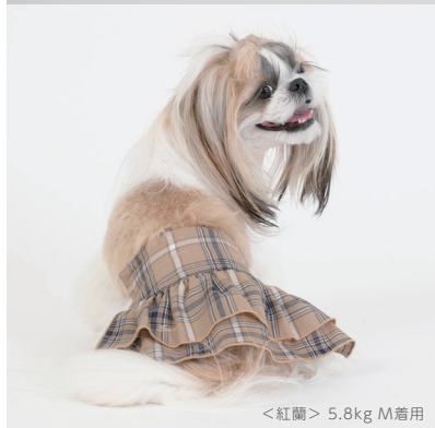
<紅蘭> 5.8kg M着用