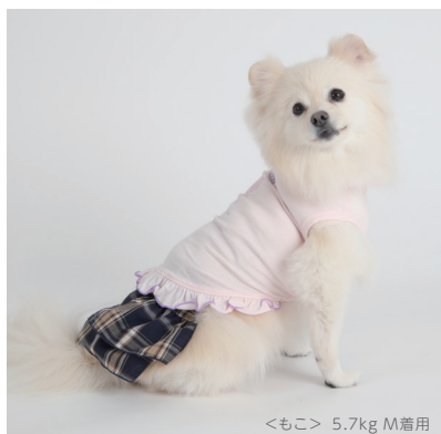
<もこ> 5.7kg M着用

クラシックなチェック柄からカジュアルなデニム風まで豊富なラインナップがうれしいマナースカート。タンクトップとのレイヤードスタイルも楽しめます。