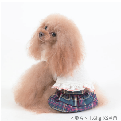
<愛音> 1.6kg XS着用