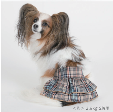
<彩> 2.9kg S着用