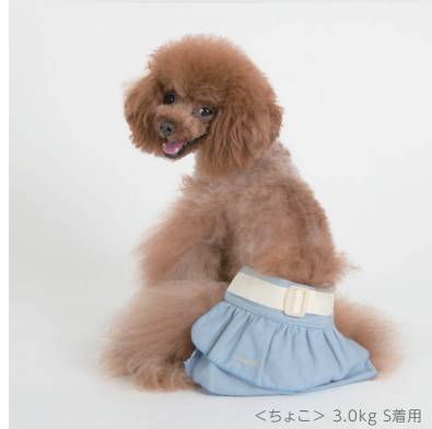
<ちよこ> 3.0kg S着用