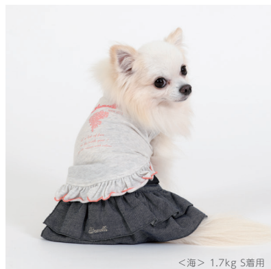
<海> 1.7kg S着用